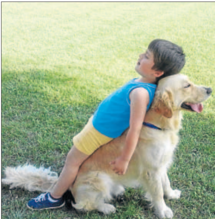
Un niño con autismo, durante una sesión de terapia asistida con animal.