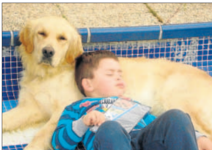
Un niño autista, tumbado junto a un perro.